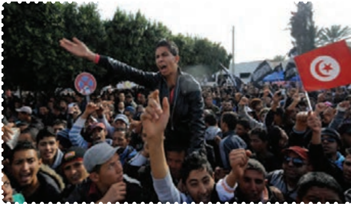
تظاهرات مردم تونس علیه دیکتاتور وابسته به غرب

الف) بیداری اسلامی در تونس: تونس کشوری اسلامی در شمال آفریقا است که در کنار دریای مدیترانه واقع شده است و به دلیل موقعیت جغرافیایی، سیاسی، تجاری و سوق‌الجیشی، نقش مهمی را در سیاست کلی آفریقا و کشورهای عربی برعهده دارد و به همین علت، از دیرباز مورد طمع قدرت‌های استعماری بوده است. به گونه‌ای که ژول فری، نخست وزیر اسبق فرانسه از تونس به عنوان «کلید خانهٔ فرانسویان» یاد می‌کند. ۱ فعالیت‌های سیاسی در تونس به دلایل مختلف، از جمله نزدیکی جغرافیایی با اروپا، آشنایی اکثریت مردم به زبان فرانسه، وجود مراکز متعدد آموزش عالی، رفت و آمد میلیون‌ها جهانگرد خارجی به خصوص اروپاییان، گسترش فعالیت مطبوعات و به‌طور کلی گسترش آگاهی‌های عمومی مردم، از سایر کشورهای منطقه و جهان عرب بیشتر است. کوشش مردم تونس برای کسب استقلال و آزادی پس از جنگ جهانی دوم افزایش یافت و دولت فرانسه به ناچار استقلال آن کشور را به رسمیت شناخت و در سال ۱۳۳۵ ش/ ۱۹۵۶م به‌عنوان