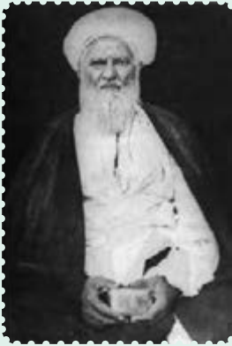
آیت‌الله عبدالکریم حائری یزدی

یکی از اقدام‌های هوشمندانه مرجعیت شیعه در ایران، تأسیس حوزه علمی قم در سال ۱۳۰۱ ش پس از شکست عثمانی در جنگ اول و اشغال عراق توسط انگلیس بود، که توسط آیت‌الله «حاج شیخ عبدالکریم حائری یزدی» انجام گرفت. تا قبل از تأسیس حوزه علمی قم، پایگاه علمی مرجعیت شیعه، عمدتاً در نجف اشرف و دیگر شهرهای مذهبی عراق متمرکز بود. این اقدام ارزشمند و خردمندانه، در عصری که استعمار در صدد اجرای نقشه‌های ضد دینی خود در منطقه بود، پس از عصر صفویان، موجب تقویت ایران به عنوان پایگاه فقه و معارف شیعه شد. علاوه بر آن، زمینه را برای مهاجرت علما و مراجعی که علیه سیاست‌های استعماری انگلستان مبارزه می‌کردند، فراهم آورد.