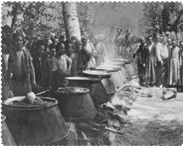
دیگ‌های غذا در سفارت انگلیس برای مشروطه خواهان

بدون پناهندگی به سفارت انگلستان، می‌توانستند به خواسته‌های خود دست یابند. دولت انگلستان بر خلاف دولت روسیه که از دربار حمایت می‌کرد، به ظاهر پشتیبان نهضت مشروطه بود. انگلستان، برای نیل به مقاصد و منافع استعماری‌اش این سیاست را در پیش گرفته بود. اما کسانی که از سیاست پیچیده استعمار انگلستان درک روشنی نداشتند