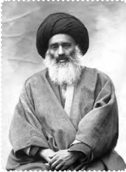
آیت الله بهبهانی