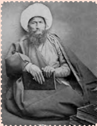
آیت‌الله حاج ملاعلی کنی

آیت‌الله ملاعلی کنی ملقب به رئیس‌المجتهدین (۱۱۸۴ - ۱۲۶۷ ش.) از علمای معروف و مبارز ایران در قرن سیزدهم و اوایل قرن چهاردهم