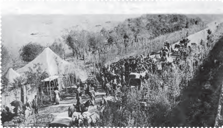
بازگشت علما از مهاجرت کبری

مظفرالدین شاه تسلیم خواسته‌های مردم شد. او عین‌الدوله را عزل کرد و فرمان تشکیل مجلس شورای ملی را در ۱۴ مرداد ۱۲۸۵ صادر کرد. هفت روز بعد، علما، با استقبال پرشکوه مردم، از قم بازگشتند. شهر چراغانی و جشن شادی به پا شد و در ۲۸ مرداد، اولین دوره مجلس شورای ملی با حضور نمایندگان تهران تشکیل گردید. عده‌ای از سیاستمداران مشروطه‌خواه، به تدوین قانون اساسی پرداختند ۱ . آنان با عجله آن را نوشتند و به امضای مظفرالدین شاه رساندند. شاه، ده روز پس از امضای قانون اساسی، درگذشت. به این ترتیب، کشور استبداد زده‌ی ما، با بهره‌گیری از اندیشه‌های سیاسی عالمان بزرگ دینی، کوشش فرهیختگان جامعه و مجاهدت مردم، به حکومتی دست یافت که می‌بایست براساس قانون اداره می‌شد.