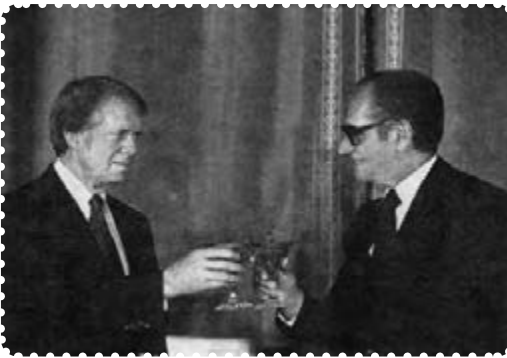
کارتر و شاه

در این درس با وضعیت کشور در آستانه انقلاب اسلامی آشنا می‌شوید. سوء استفاده آمریکایی‌ها از ایران تحت سلطه، روی کار آمدن جیمی کارتر، چگونگی برخورد با زندانیان سیاسی، سفر کارتر به ایران، رحلت آیت الله حاج آقا مصطفی خمینی، انتشار مقاله اهانت آمیز نسبت به امام خمینی، قیام نوزدهم دی قم و کشتار هفده شهریور ۱۳۵۷ در تهران مهم‌ترین موضوع‌های مورد بررسی در این درس است.