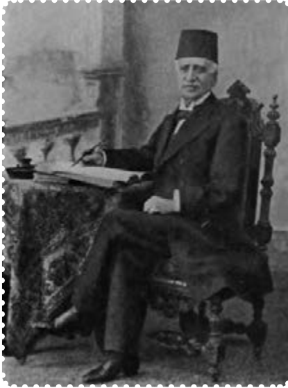
میرزا ملکم خان

او ده‌ها امتیاز اقتصادی به بیگانگان واگذار شد که سهم روسیه و انگلستان بیش از سایر کشورها بود. در نتیجه واگذاری این امتیازات، ثروت و دارایی ایران (معادن، جنگل‌ها، صنایع، گمرکات، بنادر، شیلات و...) که پشتوانه کشور و متعلق به نسل حاضر و آینده بود به تاراج رفت.