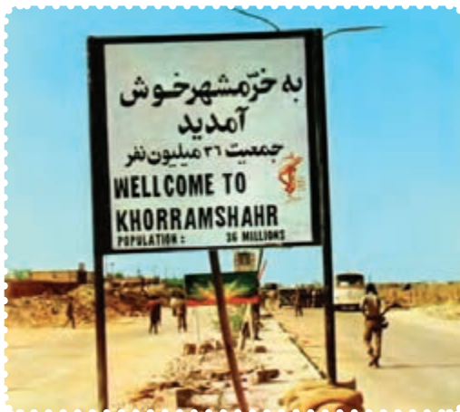
ورودی شهر خرمشهر در زمان جنگ تحمیلی

کمک به دفاع ملی دریغ نورزیدند. پس از چند هفته، دشمن متجاوز دریافت که خیال تصرف ایران، خام