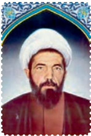
شهید دکتر محمد مفتاح

مرحله اول آن از ابتدای سال ۱۳۵۸ آغاز شد: در سوم اردیبهشت ماه ۱۳۵۸، تیمسار قرنی، اولین رئیس ستاد مشترک ارتش جمهوری اسلامی ایران را به شهادت رساندند. در شامگاه یازدهم اردیبهشت ماه همان سال، رئیس شورای انقلاب، علامه شهید، آیت‌الله مرتضی مطهری، که پس از امام، دارای بالاترین موقعیت دینی، سیاسی و فرهنگی کشور بود و از نظر علمی نیز موقعیت بسیار ممتازی در میان علمای زمان خویش داشت و از نظریه پردازان بسیار ارزشمند انقلاب اسلامی به‌شمار