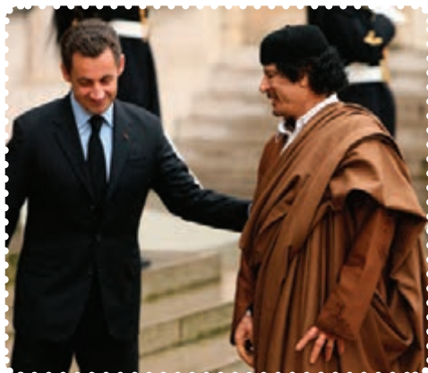
قذافی و سارکوزی رئیس جمهور پیشین فرانسه

به رغم داشتن شالوده‌های اولیه اسلامی، دارای نوعی ایدئولوژی سیاسی سکولار مبتنی بر پان‌عریسم بود. سرهنگ معمر قذافی دیکتاتور لیبی، اسلام را ابزاری برای اجرای منویات خود می‌دانست. با بالا گرفتن قیام مردم لیبی، قذافی در نخستین واکنش، قیام‌کنندگان را مشتی جوان وابسته به القاعده و مصرف‌کنندگان فرصت‌های روان‌گردان توصیف کرد. با ورود ناتو در مسئله لیبی کفه قدرت به نفع مخالفان قذافی سنگینی کرد. سرانجام پس از ماه‌ها درگیری نظامی با سقوط طرابلس، حکومت قذافی سرنگون و خود او کشته شد. نکته جالب در مورد قذافی این است که وضعیت او بیش از هر دیکتاتوری به صدام شبیه بود.