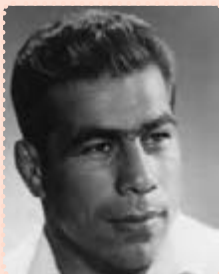
غلامرضا تختی (۱۳۰۹-۱۳۴۷ ش)

غلامرضا تختی در سال ۱۳۰۹ در محله «خانی‌آباد» تهران، در خانواده‌ای محروم به دنیا آمد. علاقه به ورزش، به‌ویژه رشته کشتی، از دوران کودکی در او وجود داشت. همین علاقه و استعداد زیاد باعث شد بسیار زود به قهرمانی کشور برسد.