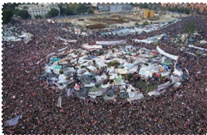
قیام مردم مصر در میدان التحریر (آزادی)

زبانہ کشید و بہ سرعت بہ مناطق دیگر ہم سرایت کرد. امواج سہمگین انقلاب مردم حسنی مبارک را مجبور بہ تسلیم و شکست کرد.