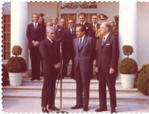
محمد رضا شاه در دیدار با نیکسون رئیس جمهور آمریکا

سیاست خارجی: سیاست خارجی حکومت پهلوی در فاصله ۱۳۴۳ تا ۱۳۵۶ ش، همچون سال‌های پیش از آن و حتی بیشتر از آن تحت تأثیر منافع و اغراض قدرت‌های بزرگ جهان و به خصوص آمریکا قرار داشت.