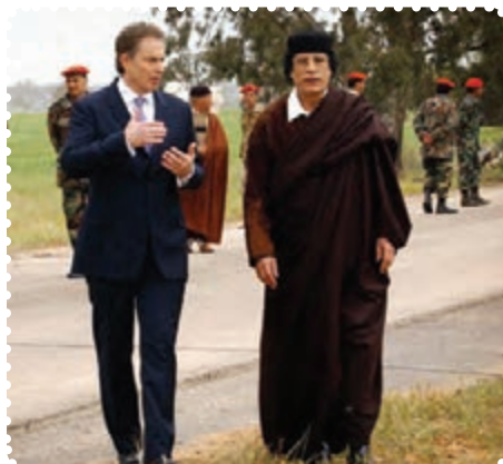
سرهنگ قذافی دیکتاتور پیشین لیبی در کنار