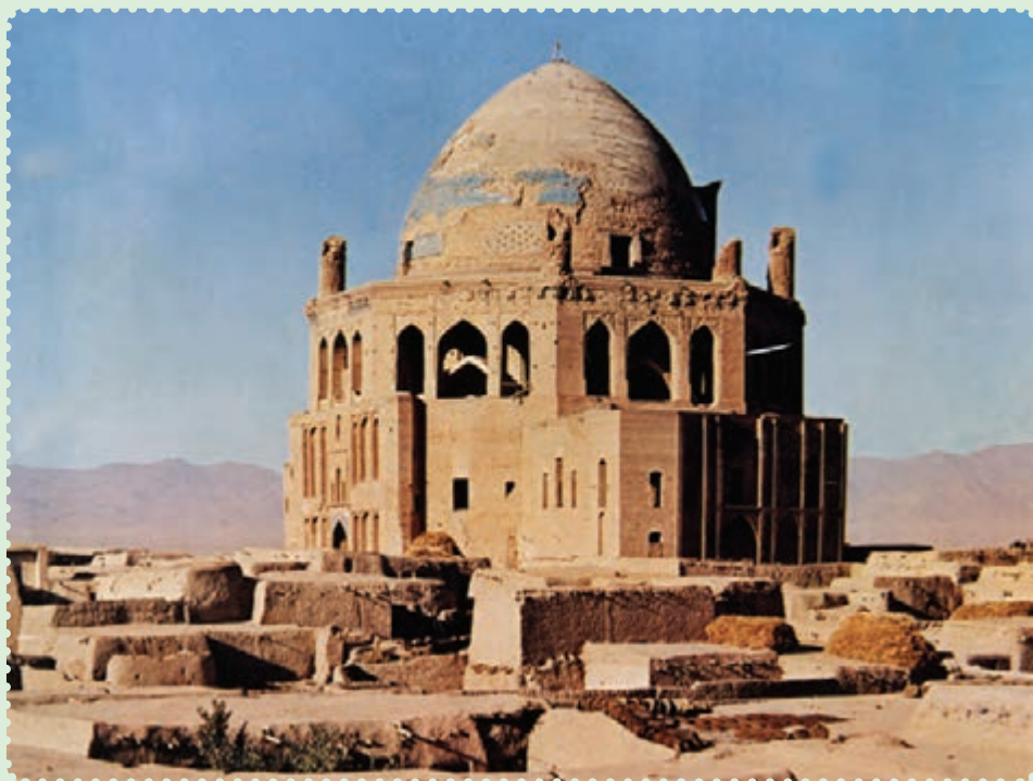
مقبره الجایتو، سلطانیه

چنگیزخان انجامید. این حادثه بهانه‌ای برای حمله به ایران بود. ۱ لشکرکشی مغولان یکی از بزرگ‌ترین راهپیمایی‌های نظامی تاریخ به‌شمار می‌رود. حدود ۲۵۰ هزار نفر از قبایل مغول، در سرمای سخت از سرزمین مغولستان در شمال چین، به فرماندهی تموچین (چنگیزخان) به سوی ایران سرازیر شدند. ۲ هدف نخستین آنها شهر اُترار بود، اما پس از قتل عام اهالی این شهر و دستگیری عاملان قتل بازرگانان، به سوی شهر بخارا و سایر ایالت‌های ایران پیشروی کردند. ۳ حمله مغول همچون طوفانی سهمگین، نه تنها طومار حکومت خوارزمشاهی را در هم پیچید، بلکه بیشتر شهرهای ایران را ویران و مظاهر تمدن باشکوه دوران اسلامی را نابود کرد. دامنه این تندباد، علاوه بر ایران، بخش‌های زیادی از جهان اسلام را نیز درنوردید. ۴