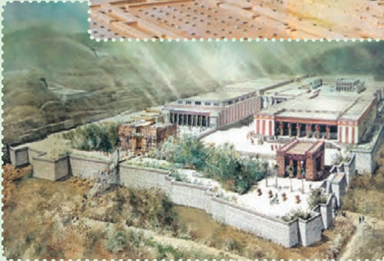
کاخ آپادانا - شوش

یافته است. ۱ برخی معتقدند، «ذوالقرنین» که در قرآن مجید ۲ به عنوان فرمانروایی نیک سیرت ستوده شده، همان کوروش پادشاه ایران است. ۳ با اینکه مؤسس دولت مقتدر هخامنشیان از سرزمین پارس