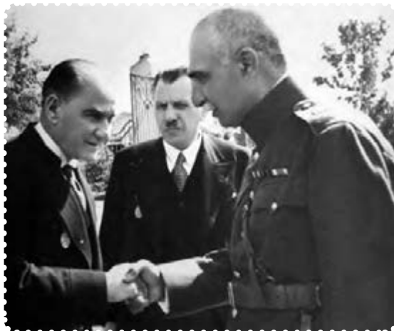
رضا شاه هنگام ملاقات با آتاتورک در ترکیه