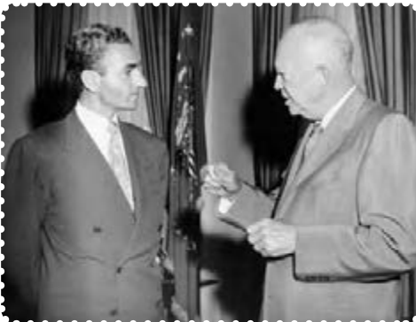
شاه در ملاقات با آیزنهاور رئیس‌جمهور آمریکا

آمریکا که از کمک به دولت دکتر مصدق اجتناب می‌کرد، پس از پیروزی کودتاچیان کمک‌های زیادی در زمینه‌های نظامی و اقتصادی به دولت کودتا کرد. ۱ باروی کارآمدن دولت نظامی زاهدی ۲ ، فضای تیره‌ای در جامعه ایران حکم فرما شد، فرمانداری نظامی تهران به سرتیپ تیمور بختیار سپرده شد. بختیار که افسری بی‌رحم و خونریز بود، برای استقرار و تثبیت حکومت کودتا، سرکوب نیروهای ضدکودتا