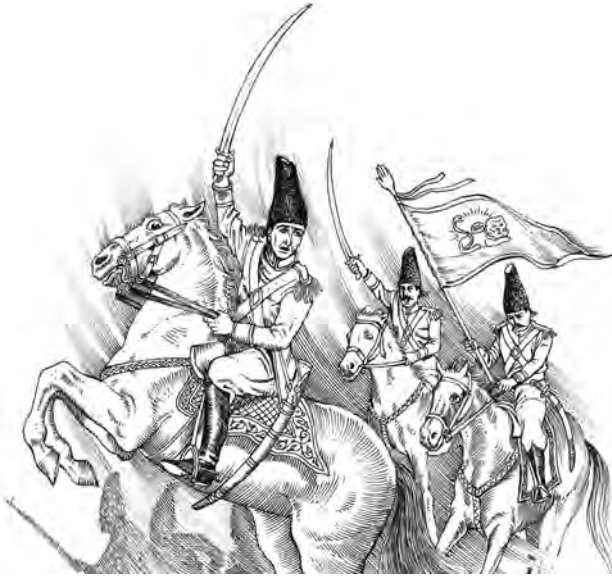
آقامحمدخان مؤسس حکومت قاجاریه

به این ترتیب، آقامحمدخان توانست سلسله قاجار را در ایران بنیاد نهد. وی تهران را که در آن زمان روستایی در حومه ری بود به پایتختی برگزید. این سلسله از سال ۱۱۷۴ تا ۱۳۰۴ ش، یعنی قریب ۱۳۰ سال، بر ایران فرمانروایی کرد.