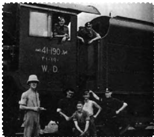
اشغالگران از راه آهن ایران برای مقاصد نظامی خود استفاده می‌کردند.

سرانجام در سوم شهریور ماه ۱۳۲۰/۲۵ اوت ۱۹۴۱ سفیران انگلیس و شوروی، طی