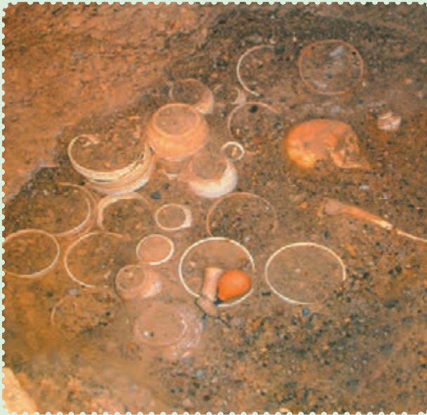
آثار یافت‌شده در شهر سوخته

پس از مدتی، زردشت که پیامبر ایران باستان است در میان ایرانیان ظهور کرد. او مردم را به پیروی از خدای یگانه که اهورامزدا نام داشت، دعوت کرد و مروج اندیشه، گفتار و کردار نیک بود. اعتقاد به سرای آخرت و جهان پس از مرگ، عقیده به آخرالزمان و ظهور یک منجی که حکومتی با عدل و داد و به‌دوراز ناپاکی و ستم برپا خواهد کرد، از بنیان‌های استوار و اعتقادی ایرانیان بوده است که آن‌ها را از سایر ملل دوران باستان متمایز می‌ساخت. ۲