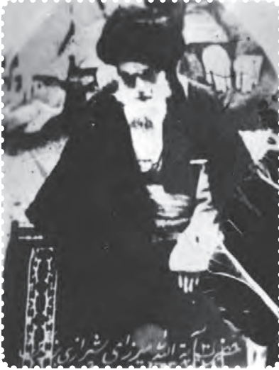
آیت الله میرزای شیرازی