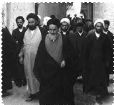
امام خمینی، سال‌های تبعید در نجف

اسلامی و آزادی خواهان جهان جای گرفت. صفات و ویژگی‌هایی که در امام یکجا جمع شده بود، از وی شخصیت بی‌بدیل و متمایزی ساخته بود. ۱