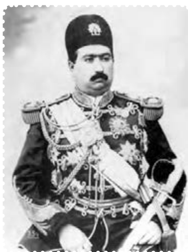
محمد علی شاه قاجار

بعد از مظفرالدین شاه، ولیعهد او، محمدعلی میرزا، با عنوان محمدعلی شاه، یکی از شاهان خودکامه دوره قاجار بود که نمی‌خواست در برابر قانون اساسی و مجلس شورای ملی تمکین کند. او در ۲۸ دی ۱۲۸۵ جشن تاج‌گذاری بر پا کرد و از اشراف و نمایندگان دولت‌های خارجی برای شرکت در این مراسم دعوت به عمل آورد، اما نمایندگان مجلس شورای ملی را دعوت نکرد. این، اولین بی‌اعتنایی محمدعلی شاه به مجلس بود. او ملت را بنده و برده خود می‌پنداشت و نمایندگان مجلس را برای دخالت در امور کشور و مشورت در سیاست، لایق نمی‌دانست. ۱