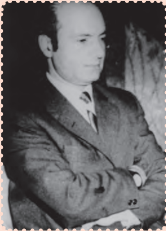
دکتر علی شریعتی (۱۳۱۲-۱۳۵۶ ش)