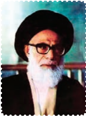
شهید آیت الله دستغیب

خواست تا به افسران فراری خارج از کشور بپیوندند. اما این قتل‌های ناجوانمردانه، مردم را در عزم خویش استوارتر می‌ساخت. ترورهای پی‌درپی منافقین، تنها شخصیت‌های بلندپایه کشور را دربر نمی‌گرفت، آنها فقط در عرض یک ماه، ۳۷۰ نفر زن، مرد و حتی کودک را آماج حملات خود قرار دادند. برای ایجاد رعب و وحشت، بسیاری از ترورها مقابل چشمان سایر اعضای خانواده انجام می‌شد. تروریست‌ها حتی در مساجد و کانون‌های دینی و مصلاهای نماز جمعه، به انفجار بمب و ترور ائمه جمعه و جماعات اقدام می‌کردند. شهدای محراب، آیت‌الله سیدعبدالحسین دستغیب در شیراز، آیت‌الله مدنی در تبریز، آیت‌الله صدوقی در یزد، آیت‌الله اشرفی اصفهانی در کرمانشاه و حجت‌الاسلام هاشمی‌نژاد، دانشمند و روحانی مؤثر مشهد، از این جمله بودند. ترور این دانشمندان و حتی عالمانی از روحانیان اهل سنت، نشانگر این بود که دشمنان انقلاب بیش از هر چیز، از اندیشه متفکران اسلامی بیمناک‌اند.