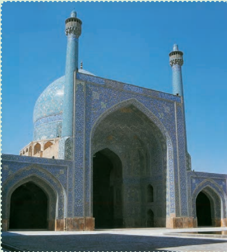
مسجد امام از آثار دوره صفوی در اصفهان

صفویان حکومتی تشکیل دادند که بیش از دو سده دوام یافت. در پرتو این حکومت مقتدر، علاوه بر برقراری امنیت و رونق اقتصادی، پیشرفت بازرگانی و کشاورزی و صنعت، تشکیل ارتش منظم و سیاست خارجی مقتدرانه، آنها توانستند فرهنگ و تمدن ایران و اسلام را بار دیگر شکوفا کنند. هنر و معماری در این دوره نیز از نظر کمی و کیفی توسعه و تحول یافت. اصفهان، پایتخت صفویان، دارای مجموعه‌ای از معماری عصر صفوی است که نشان می‌دهد، معماری ایرانی