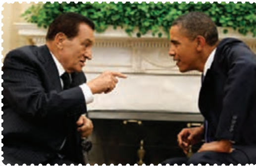
مبارک دیکتاتور مخلوع مصر و او بامار رئیس‌جمهور پیشین آمریکا

جامعه مصری از قدیم‌الایام ساختار مذهبی داشته و خاستگاه بسیاری از پیامبران الهی بوده است. از زمان ظهور اسلام تا دوران معاصر این کشور فارغ از کشاکش‌های سیاسی و مداخلات استعماری، از نظر اندیشه سیاسی و دینی رشد والایی داشته است و علما و متفکران بسیاری را در خود پرورش داده است.