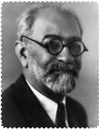
محمد علی فروغی

با انتقال سلطنت به سلسله پهلوی، محمدعلی فروغی (ذکاءالملک ۱ ) به عنوان اولین نخست‌وزیر دوران سلطنت رضاشاه منصوب شد. نخستین اقدام او، برپایی آیین تاج‌گذاری و نشستن رضاشاه بر تخت قدرت بود.