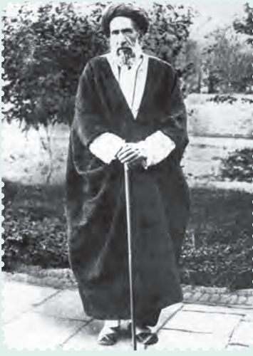
سید حسن مدرس نماینده ادوار مختلف مجلس شورای ملی

اقدام های خودسرانه و خشونت آمیز رضاخان در دوران تصدی وزارت جنگ، منجر به طرح استیضاح او در مجلس، به رهبری آیت الله سید حسن مدرس شد اما رضاخان، با طرح شایعه استعفای خود و صحنه سازی، طرفدارانش را علیه مجلس تحریک کرد و مخالفان را مورد ضرب و شتم و ارباب، قرار داد.