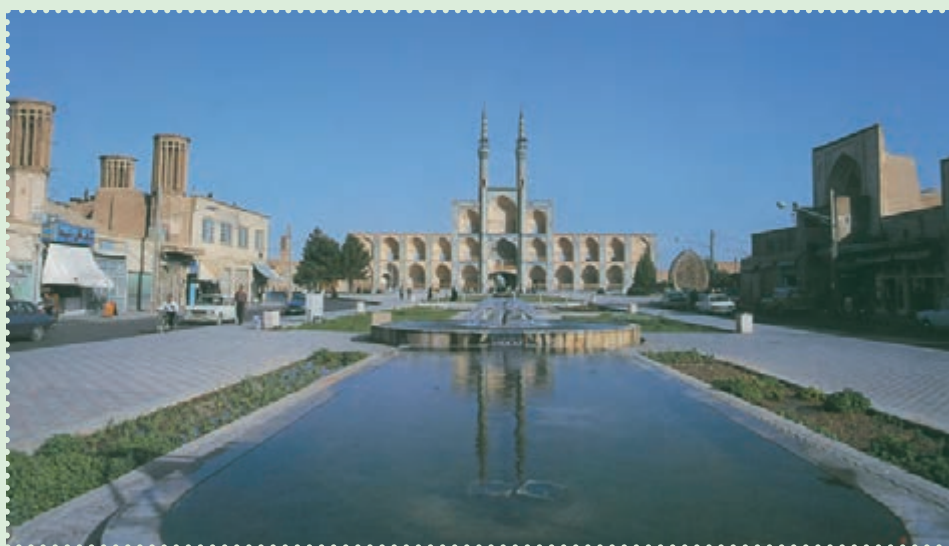
میدان تاریخی امیر چخماق در مرکز شهر یزد

با آنکه مغولان در آغاز ویرانی های بسیاری به همراه آوردند، ولی بر اثر آشنایی با فرهنگ ایران و اسلام، از طریق آنان فرهنگ، هنر و تمدن ایران و اسلام رواج یافت. پس از پایان حکومت ایلخانان، حکومت های ملوک الطوائفی و محلی متعددی چون تیموریان، آل جلائر، آل مظفر، سرداران و آل کرت، اتابکان، قراقویونلوها و آق قویونلوها طی قرن های هشتم و نهم قمری بر ایران حکومت کردند، اما هیچ کدام نتوانستند یکپارچگی ایران را حفظ کنند. سرانجام در سال ۹۰۷ق، حکومت صفوی توانست پس از