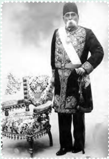
عبدالمجید میرزای عین الدوله

به هم ریخت؛ بازارها بسته شد و مردم در «مسجد شاه» گرد آمدند. در پی این تجمع، مردم نیرو گرفتند و کشمکش بین طرفداران استبداد و عدالت خواهان، شدت گرفت. دولت به وحشت افتاد و با پادرمیانی حاج میرزا ابوالقاسم امام جمعه، به طور موقت، قضیه فیصله یافت. حاج میرزا ابوالقاسم، داماد مظفرالدین شاه بود. او از جانب شاه به امامت جمعه تهران منصوب شده بود و از وی و دربار، پشتیبانی می کرد.