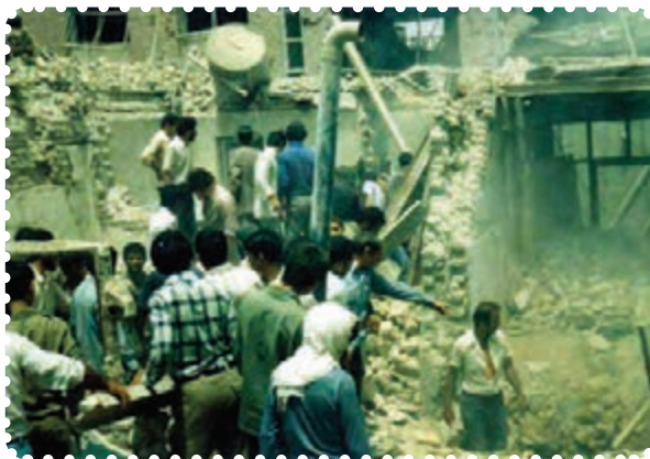
دزفول در پی یکی از حملات موشکی

در طول مدت جنگ شهرها، ارتش عراق موشک‌های دوربرد بسیاری به شهرهای ایران پرتاب کرد. ۱ به علاوه، استفاده از گازهای شیمیایی در جبهه‌های جنگ را در پیش گرفت. در چنین شرایطی، آمریکا رسماً به کمک نیروهای صدام آمد. اعزام ناوگان جنگی به خلیج فارس و هدف قرار دادن هواپیمای مسافربری ایران در تیرماه ۱۳۶۷، از جمله اقدامات ناجوانمردانهٔ آمریکایی‌ها بود.