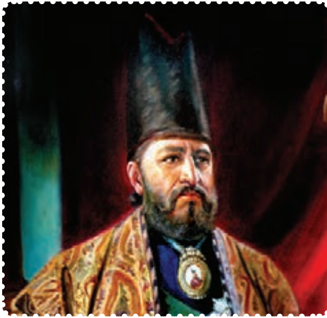
میرزا تقی‌خان امیرکبیر

کوتاه صدارت، برای حفظ تمامیت ارضی و مبارزه با دخالت بیگانگان، تلاش زیادی کرد. در روزگار او، سیاست داخلی و خارجی ایران به شدت تحت تأثیر دولت‌های بیگانه، به‌ویژه روسیه و انگلیس قرار