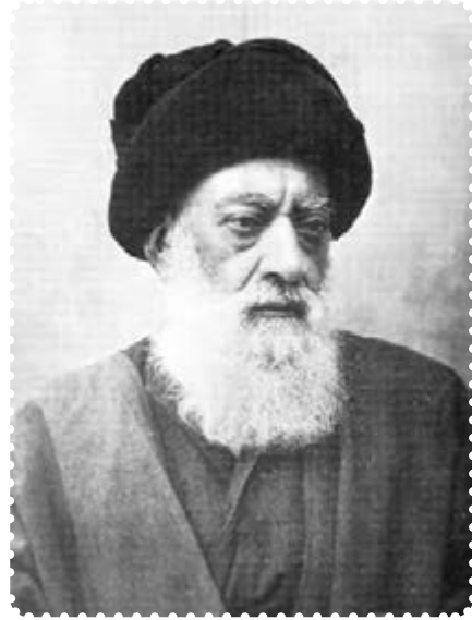
آیت الله طباطبایی