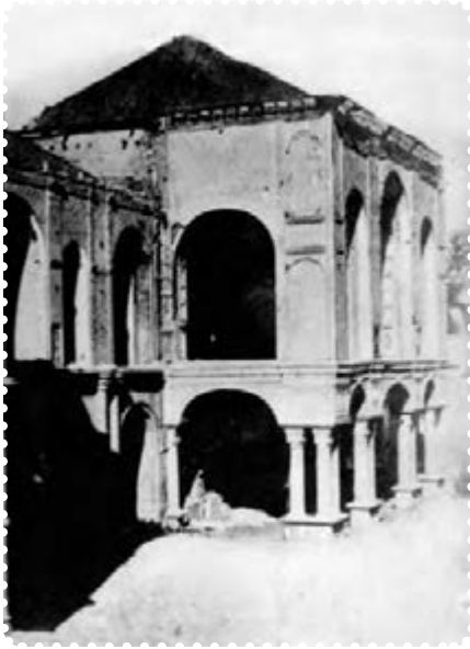
ساختمان مجلس شورای ملی پس از به توپ بستن توسط لیاخوف در ایام مشروطیت

ملک‌المتکلمین و سید جمال‌الدین واعظ اعدام شدند. بعضی از نمایندگان نیز که مورد تعقیب قرار گرفته بودند (از جمله تقی‌زاده)، به سفارت انگلیس پناه بردند. ۱ بدین گونه، دوباره، برای مدتی، استبداد حاکم شد. این دوره که یک سال به طول انجامید بار دیگر استبداد به جای مشروطیت حاکم شد. از این رو آن را دوره استبداد صغیر نامیده‌اند.