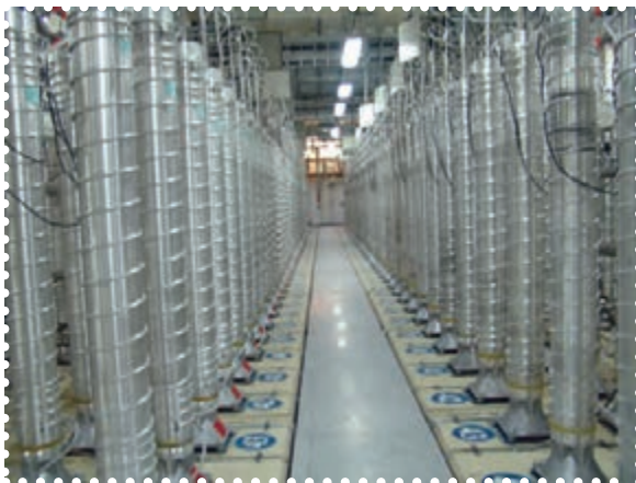
تأسیسات هسته ای نظنز

دستیابی به فناوری هسته ای صلح آمیز، یکی از عظیم ترین و افتخار آمیزترین دستاوردهای فنی و علمی انقلاب اسلامی است. دسترسی به چرخه سوخت هسته ای، یعنی فرایند تبدیل اورانیوم طبیعی به