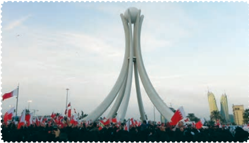
میدان لؤلؤ، نقطه آغازین قیام بحرینیان

و دگرگونی‌های جدید سیاسی در بحرین به حساب آورد. مردم بحرین به‌طور جدی خواستار انجام اصلاحات اساسی و برکناری حکومت آل خلیفه هستند و در این راه شهدای زیادی را تقدیم کرده‌اند ولی به دلیل حمایت خارجی از آن رژیم و سرکوب شدید مردم، انقلاب بحرین هنوز به نتیجه نرسیده است.