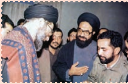
شهید عارف حسینی در محضر رهبر انقلاب اسلامی حضرت آیت‌الله خامنه‌ای

رهبر انقلابی شیعیان پاکستان و رهبر نهضت اجرای فقه جعفری پاکستان؛ وی از علما، دانشمندان و رهبران بیداری اسلامی پاکستان و شبه قاره هند است. او با تحصیل در حوزه علمیة نجف اشرف و حضور در کلاس‌های درس امام خمینی، در شمار یاران و پیروان امام خمینی درآمد. آشنایی وی با امام خمینی سرآغاز دگرگونی فکری و سیاسی او بود. وی در سال ۱۳۵۲ از عراق اخراج شد و به پاکستان بازگشت. در سال ۱۳۵۳ برای ادامه تحصیل راهی ایران شد و رهسپار حوزه علمیة قم گردید. وی به دلیل فعالیت‌های سیاسی در جهت نهضت امام خمینی توسط ساواک دستگیر و از ایران اخراج شد. در سال ۱۳۶۳ وی