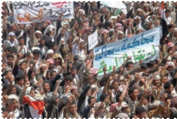
قیام مردم مسلمان یمن

ت) بیداری اسلامی در یمن: جمهوری یمن در جنوب شبه‌جزیره عربستان واقع است و دارای نژادهای عرب (۸۶ درصد)، ترک، هندی، ایرانی و سومالیایی است. بیش از ۵۰ درصد یمنی‌ها شیعی مذهب‌اند که غالباً در منطقه صعدة و شمال یمن ساکن‌اند. البته عمده شیعیان یمن زیدی‌اند که بعد از امام سجاد (ع)، زید بن علی (ع) را امام می‌دانند. مردم یمن در پی انقلاب‌های گوناگون در کشورهای اسلامی، اعتراضات و تظاهرات گسترده‌ای را در شهرهای مختلف علیه رژیم دیکتاتوری علی عبدالله صالح آغاز کردند که علی‌رغم طولانی و گسترده بودن مخالفت، با سرکوب شدید مواجه شدند. عاقبت علی عبدالله صالح از یمن گریخت ولی جانشین او نیز همان سیاست‌های غرب‌گرایانه را ادامه می‌دهد. انقلاب یمن همچنان آتش زیر خاکستر است.