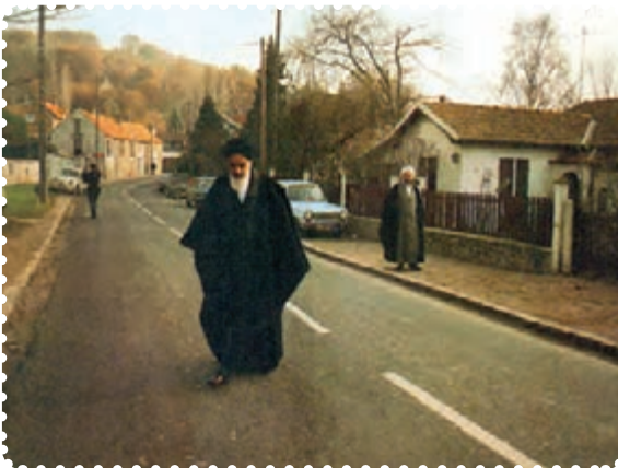
محل اقامت امام در پاریس، مرکز تجمع دانشجویان و ایرانیان ساکن آنجا بود.

با روزافزون شدن تظاهرات مردمی در ایران، رژیم عراق در پی یک توافق محرمانه با شاه و هماهنگی با آمریکا ۱ ، اقدام به اخراج امام خمینی از آن کشور کرد. امام در سیزدهم مهر ۱۳۵۷ به طرف کویت رفت. اما دولت کویت اجازه ورود به وی نداد. این درحالی بود که عراق نیز به امام، اجازه بازگشت نمی داد. در نتیجه امام خمینی و همراهانش، در پانزده مهر ۱۳۵۷ به فرانسه رفتند، ولی رئیس جمهور