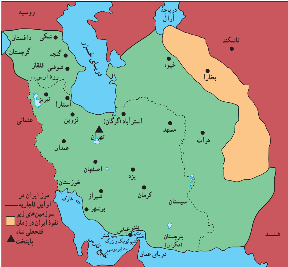
قلمرو ایران (در اوایل قاجاریه)

هجوم سیاسی- نظامی دولت‌های استعمارگر اروپایی، زمینه‌ساز بیداری اسلامی در ایران شد. عالمان دین برای مبارزه با نفوذ بیگانگان و مخالفت با سلطه استعماری از قواعد قرآنی و اسلامی مانند «قاعده نفی سبیل»، «جهاد» و «فتوا» بهره بردند. عالمانی همچون آیت‌الله شیخ جعفر نجفی کاشف الغطاء و آیت‌الله سید محمد مجاهد، که مقیم عتبات عالیات بودند، و ملا احمد نراقی و برخی از علمای ایران علیه روس‌ها فتوای جهاد دادند، و بعضی از آنها خود نیز در جبهه‌های جنگ شرکت کردند. این امر موجب شد که مردم ایران و حتی شهرهای نجف و کربلا، مشتاقانه در مناطق اشغالی به مقابله با روس‌ها پردازند و جلوی پیشروی آنان را بگیرند.