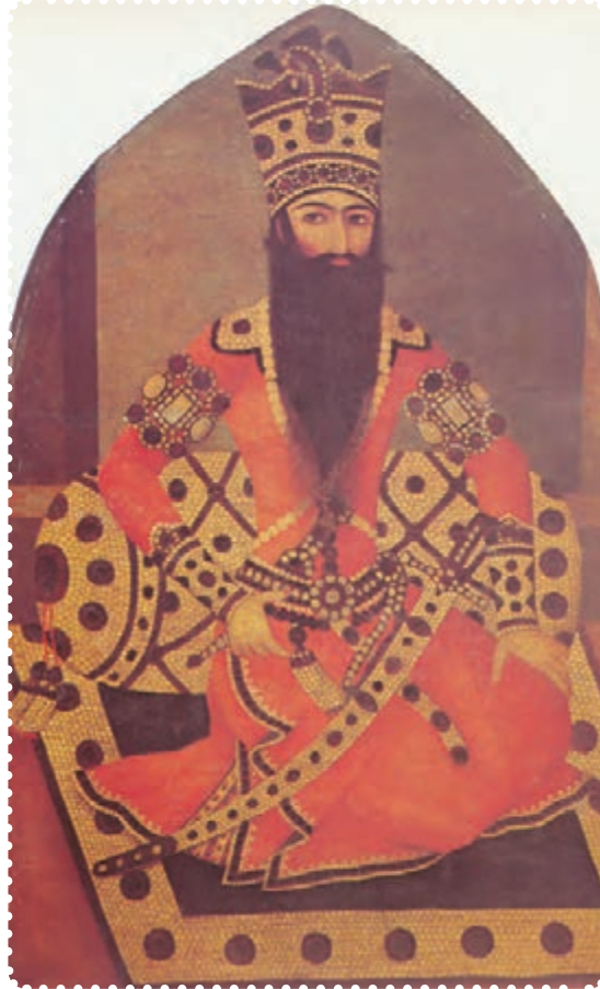
فتحعلی‌شاه، دومین پادشاه قاجاریه

ایران و روس شد. این جنگ‌ها از سال ۱۱۸۲ تا ۱۱۹۱ ش به درازا کشید، و به بسته شدن «عهدنامه گلستان» ۱ انجامید. به موجب این عهدنامه، ایران حاکمیت روسیه را بر ولایت‌هایی که تا آن زمان اشغال کرده بود به رسمیت شناخت. به این ترتیب ایالات داغستان و گرجستان و شهرهای باکو، دربند، شیروان، قره‌باغ، شکگی، گنجه، موقان و قسمت بالای طالش، به روسیه واگذار شد. به علاوه، حق کشتی‌رانی در دریای خزر، از ایران سلب گردید، در برابر، روسیه نیابت سلطنت عباس میرزا را در ایران به رسمیت شناخت و رساندن او به سلطنت را تعهد کرد. این بند که ظاهراً امتیازی برای ایران به حساب می‌آمد، در واقع به منزله نادیده گرفتن استقلال کشور و به رسمیت شناختن دخالت روسیه در امور داخلی آن بود.