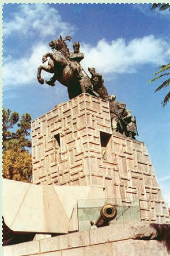
مجسمه و آرامگاه نادرشاه افشار در مشهد مقدس

توانست با شیوه حکومت داری توأم با ملاحظت، عدالت و رفاه نسبی، نام نیکی از خود بر جای بگذارد. ۱ وی تلاش کرد روابط خارجی ایران را که به دلیل هرج و مرج و نبود امنیت دچار اختلال شده بود، سامان بخشد، همچنین در برابر گسترش فعالیت‌های بازرگانی انگلستان در ایران ایستادگی کرد ۲ و از منافع نامشروع و استعماری این دولت جلوگیری به عمل آورد.