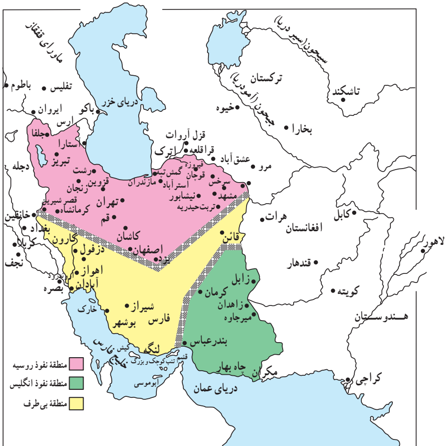
نقشه تقسیم ایران براساس قرارداد ۱۹۰۷

افغانستان که دارای ارزش حیاتی برای دفاع از هند بود، قلمرو نفوذ انگلستان مقرر گردید. قسمت سوم که شامل کویرها و بیابان‌های بی‌آب و علف بود، منطقه بی‌طرف و متعلق به ایران شناخته شد. منظور از این کار هم آن بود که دو دولت تا حدودی از یکدیگر فاصله بگیرند و از برخوردهای احتمالی بین آنها، جلوگیری شود.